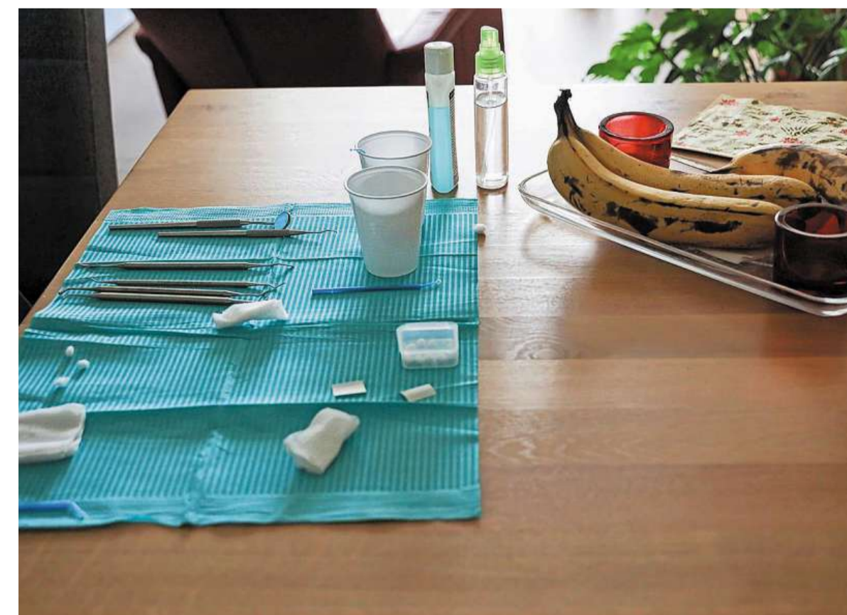
De eettafel doet dienst als werkblad.